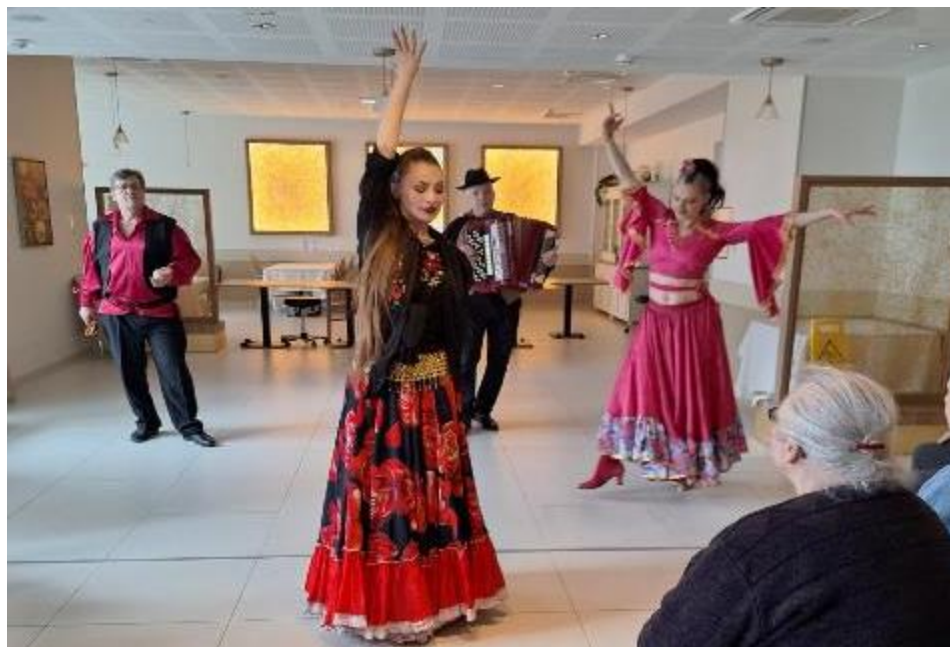
Spectacle russe « Les Cosaques » avec déjeuner à thème