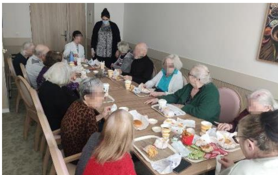
Déjeuner thérapeutique « McDonald's ». Une première pour la plupart de nos résidents !

Le lot gagnant ? Un panier en chocolat fait maison par notre Chef !